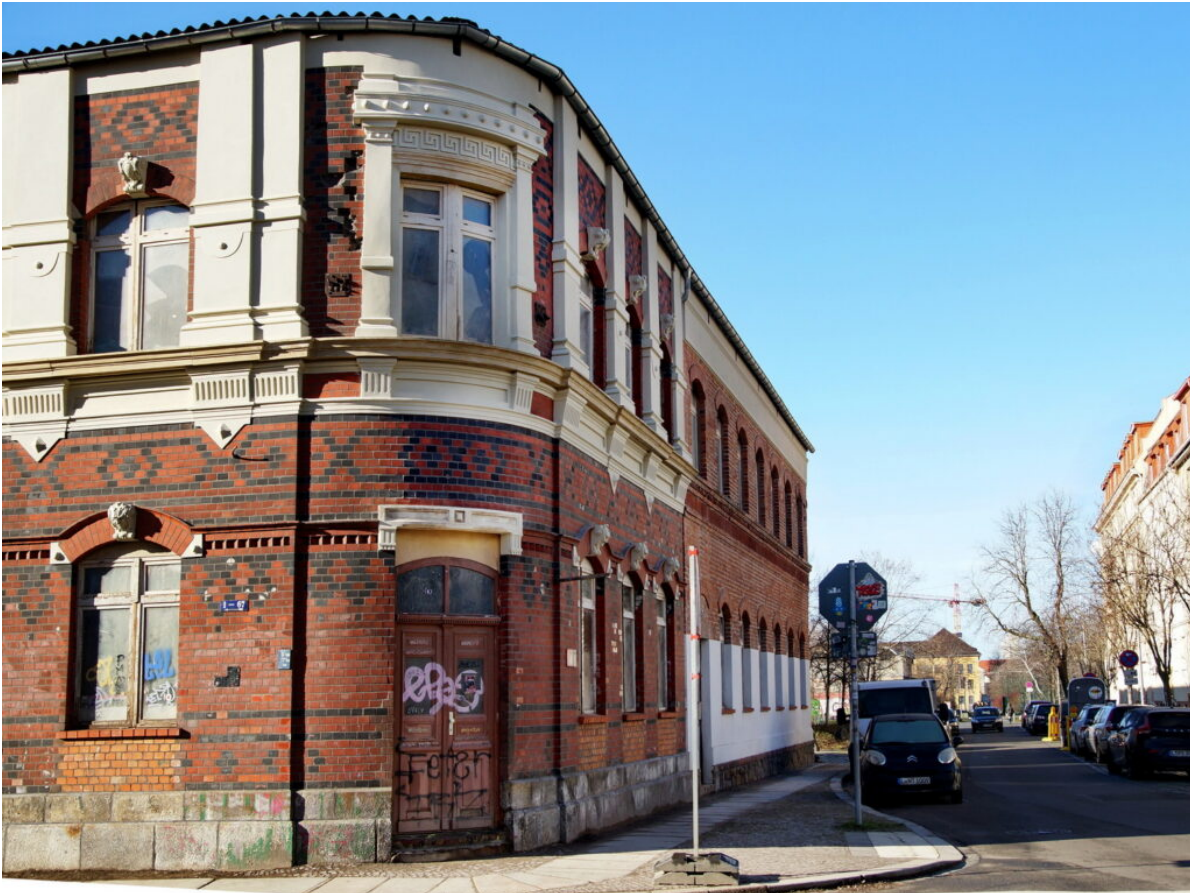
Ecke Liebmann-/ Konradstraße | Foto: Harald Stein, Februar 2022